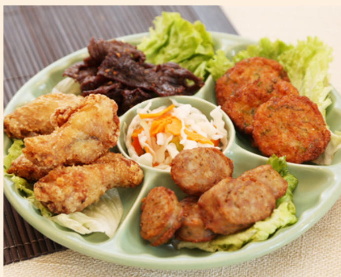
M4. 24.00€ Boeuf séché , saucisses, galettes de poisson, ailes de poulet frit