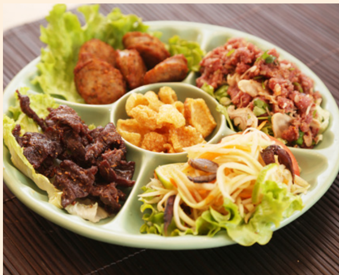
M3. 24.00€ Boeuf séché , saucisses, boeuf haché, salade de papaye