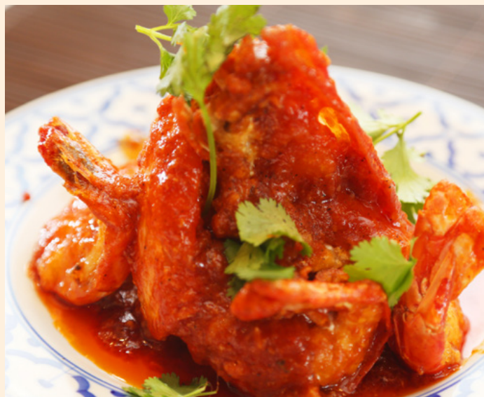
47. GAMBAS ROYALES 20.00€