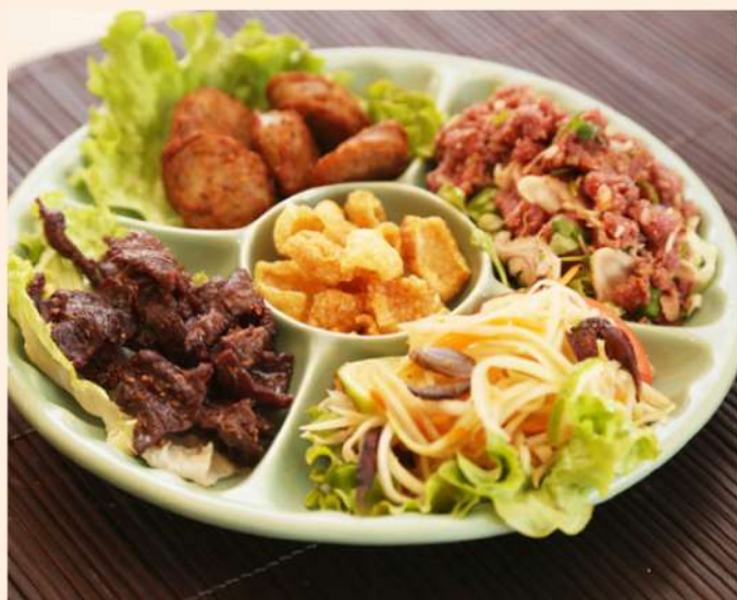
M3. 22.00€ Boeuf séché , saucisses, boeuf haché, salade de papaye