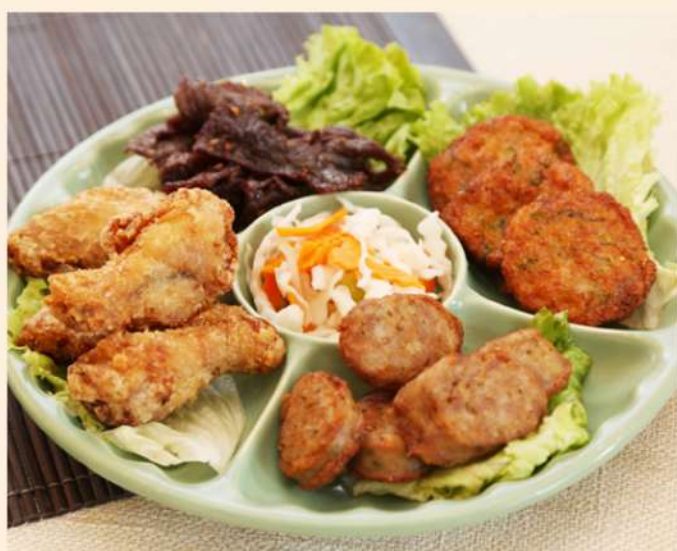
M4. 22.00€ Boeuf séché , saucisses, galettes de poisson, ailes de poulet frit