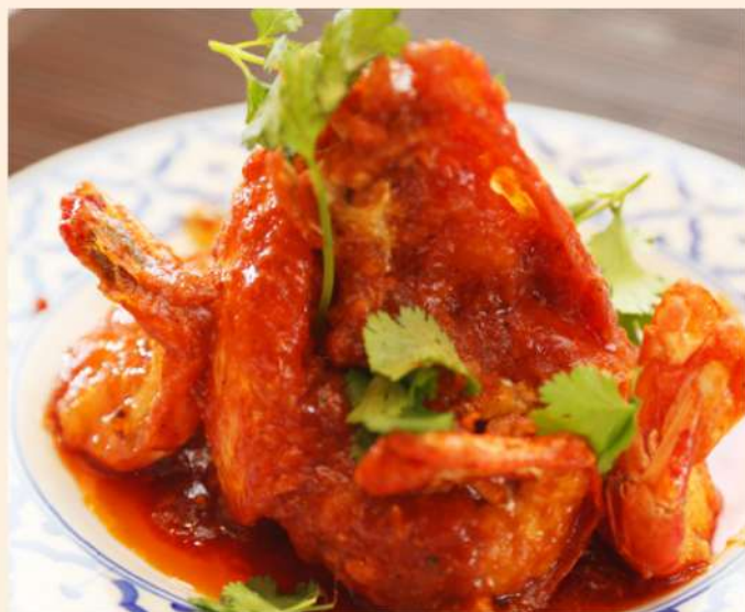
47. GAMBAS ROYALES 22.00€